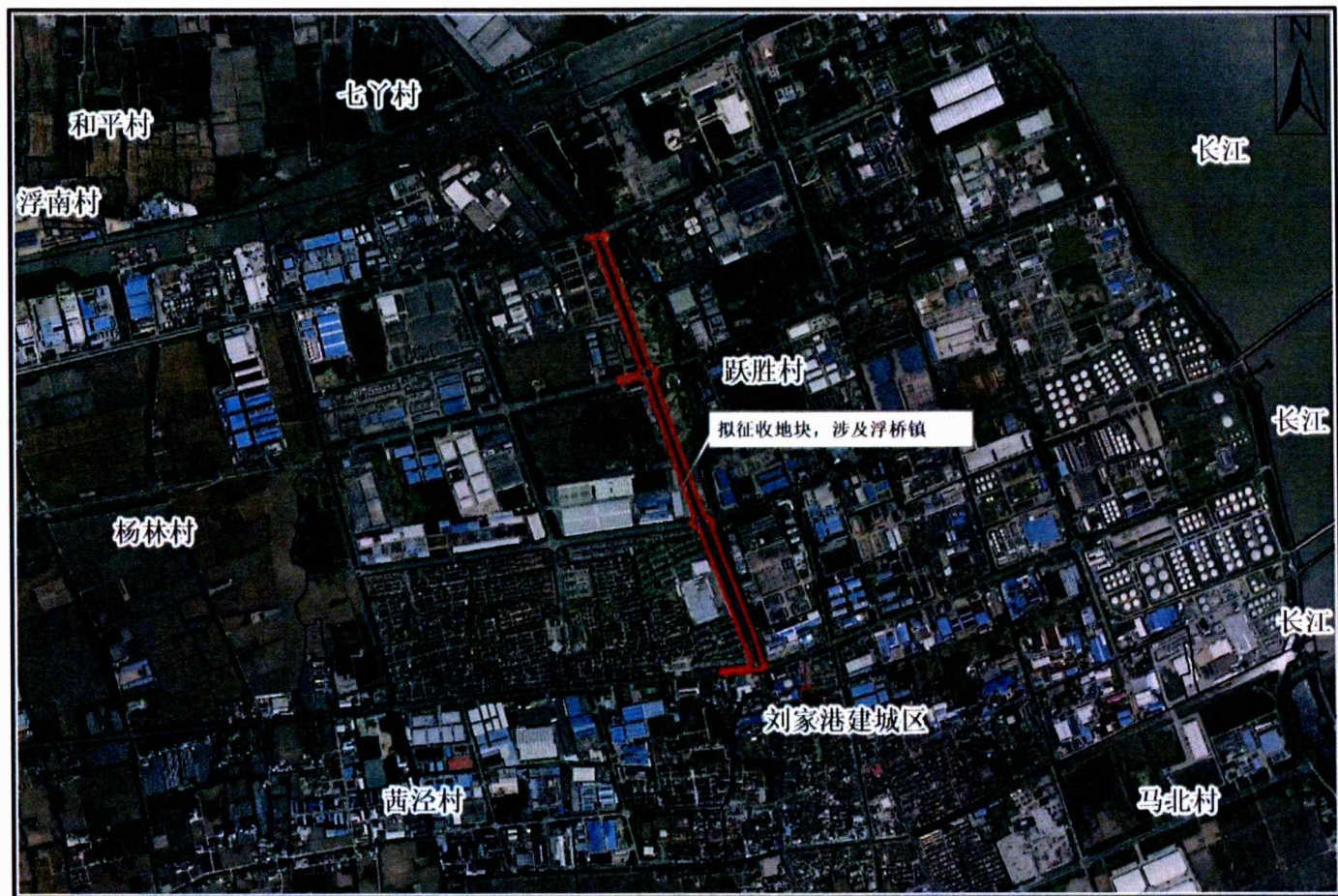
拟征收土地位置示意图